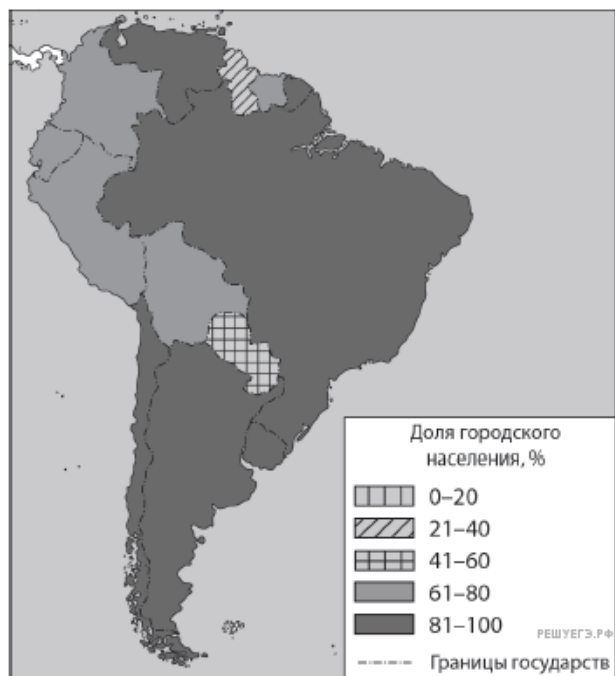
Карта составлена по состоянию на 01.01.2024