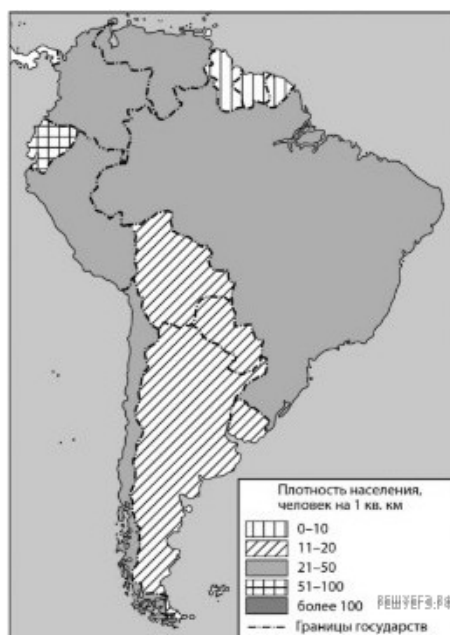
Таблица 1. Основные демографические показатели некоторых стран Южной Америки и Африки в 2023 г.