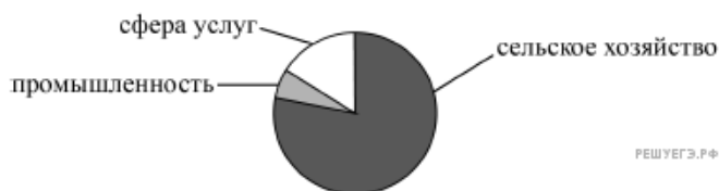
Распределение экономически активного населения по секторам экономики

22. Для какой из перечисленных стран характерно показанное на диаграмме распределение экономически активного населения по секторам экономики?