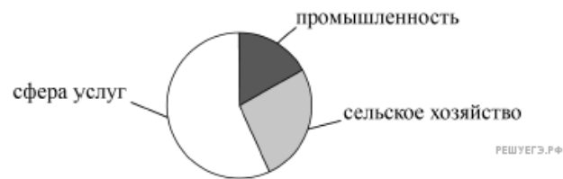
Распределение экономически активного населения по секторам экономики

23. Для какой из перечисленных стран характерно показанное на диаграмме распределение экономически активного населения по секторам экономики?